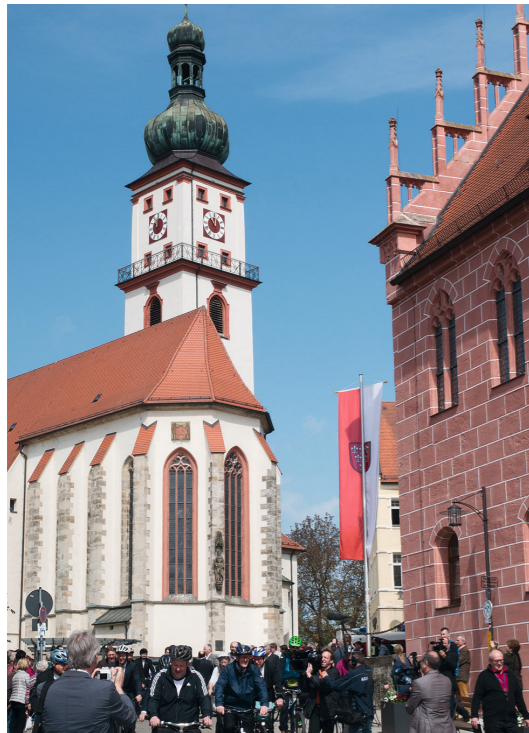
Stadtpfarrkirche St. Marien in Sulzbach, 1652-1957 simultan

Doch die gemeinsam genutzten Gotteshäuser mit ihren bewegten Geschichten können gerade in der aktuellen kirchlich-gesellschaftlichen Situation Impulse für gute Wege in die Zukunft geben.