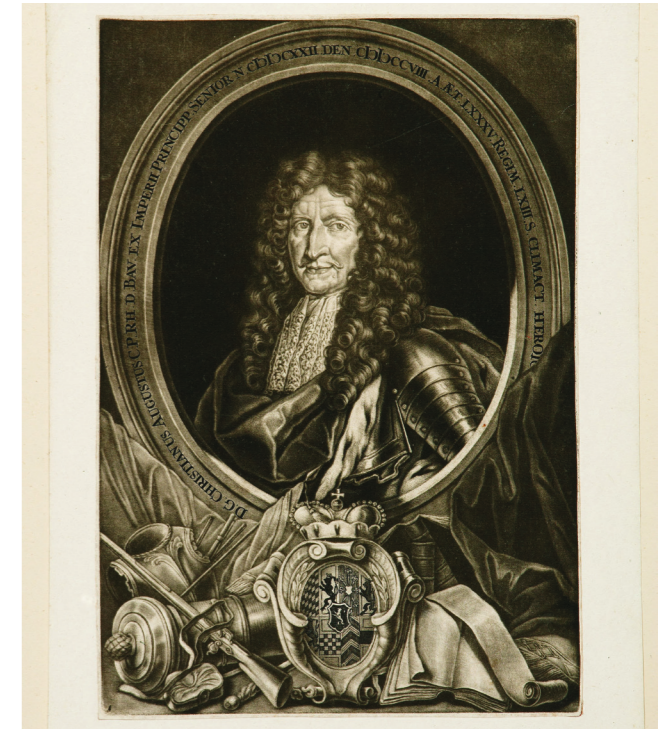
Pfalzgraf Christian August, 1622-1708

Wir laden Sie ein, Simultaneen im deutschen Sprachraum kennenzulernen und diese ökumenischen Experimente aus kirchen- und kulturgeschichtlicher Perspektive zu beleuchten.