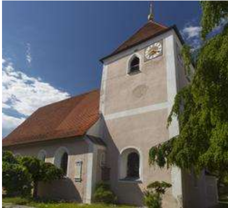
Kirche St. Nikolaus