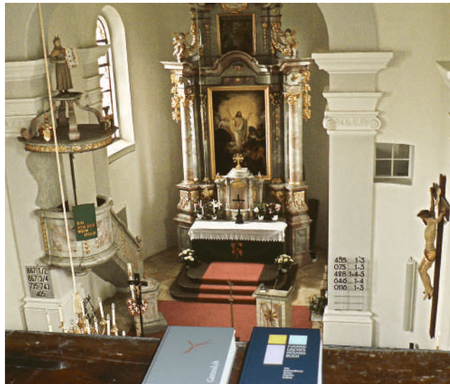
Simultankirche St. Jakobus in Wildenreuth

(Alle Infos: www.tag-des-offenen-denkmals.de )