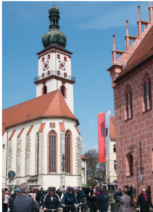
Stadtpfarrkirche St. Marien in Sulzbach, 1652-1957 simultan

Doch die gemeinsam genutzten Gotteshäuser mit ihren bewegten Geschichten können gerade in der aktuellen kirchlich-gesellschaftlichen Situation Impulse für gute Wege in die Zukunft geben.