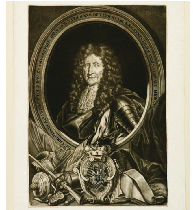
Pfalzgraf Christian August, 1622-1708

Wir laden Sie ein, Simultaneen im deutschen Sprachraum kennenzulernen und diese ökumenischen Experimente aus kirchen- und kulturgeschichtlicher Perspektive zu beleuchten.